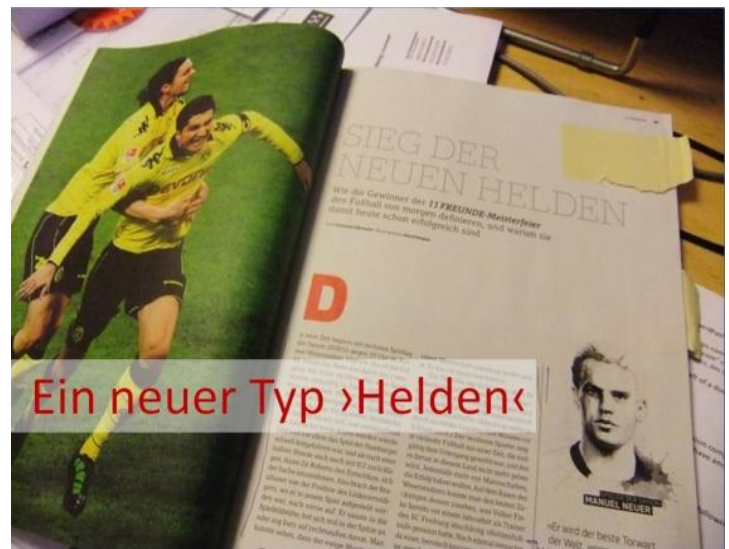
Abbildung 1: Foto vom Artikel im ›11 Freunde‹

»Nur aus Ordnung kann Kreativität entstehen. Nehmen Sie die Jazz- oder Bluesmusik. Nur wenn jeder weiß, was er zu spielen hat, kann die Kreativität eines jeden Instruments später zum Vorschein kommen. Jeder muss wissen, wo er hingehört und wann er einzusetzen hat. Man muss sich an Regeln und Ordnungen halten. Für sich kann jeder kreativ sein. Aber im Team ist es dann plötzlich widersprüchlich und es macht alles keinen Sinn, wenn keine Ordnung da ist. Deshalb