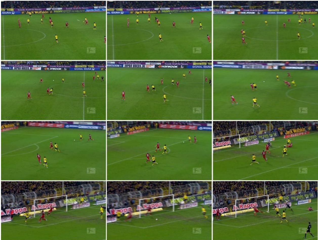
Abbildung 2: Serie von Video-Stills aus der Meistersaison-DVD, vgl. BVB (2011)

Zur weiterführenden Erklärung des Geschehens informieren wir uns bei Frank Wormuth (2011) über den Ablauf des ›perfekten Konter‹. Bevor wir aber zur eigentlichen Erläuterung kommen, sind noch folgende Hintergründe wichtig: